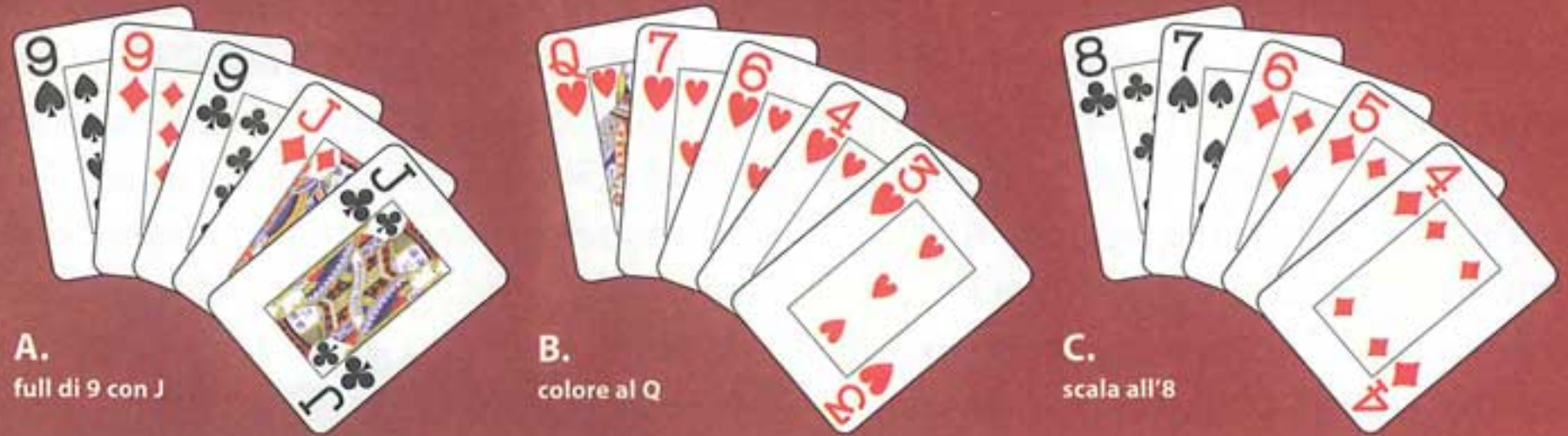
A. full di 9 con J

Conoscendo le mani preparate dal tuo avversario: