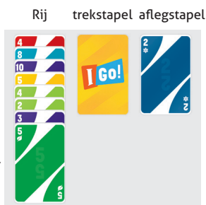
Voorbeeld voor 3 spelers