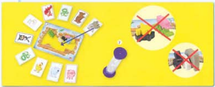
Illustration: Gabriela Silveira